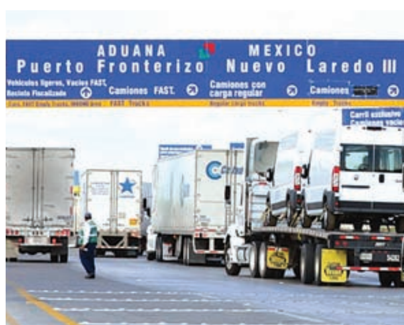
■ Las maquiladoras, agencias aduanales y transportistas le dan empleo a decenas de miles en esta frontera.

Morales consideró que uno de los sectores más afectados