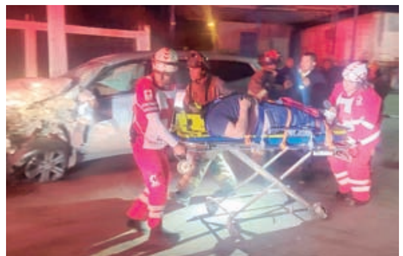
■ Los heridos se quejaban de fuertes dolores en todo el cuerpo.