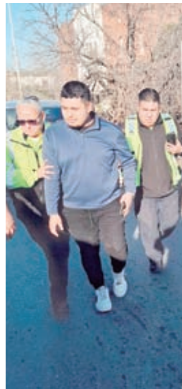
■ El irresponsable joven no midió las consecuencias de beber en exceso y manejar.