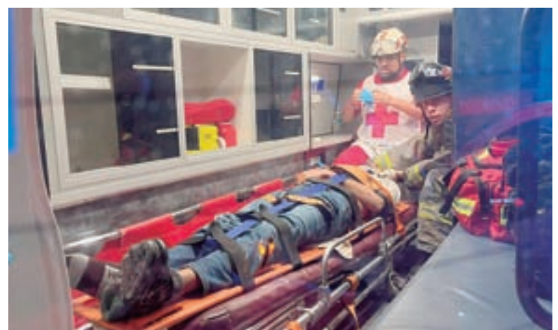
■ Paramédicos y bomberos trabajaron en la escena del percance.