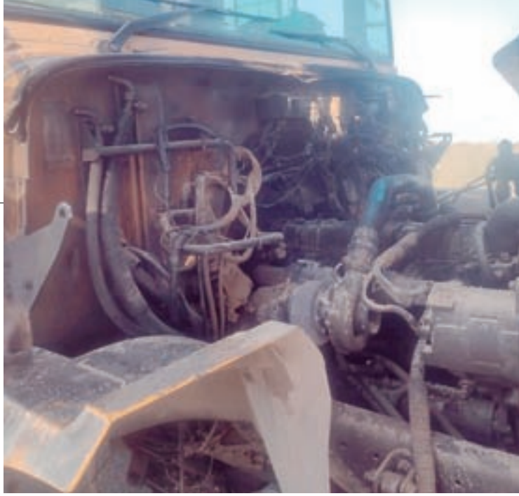
■ Las llamas se iniciaron en el área del motor del vetusto camión.

Los bomberos dieron a conocer que lo anterior ocurrió por un aparente cortocircuito en las instalaciones eléctricas de la vetusta unidad.