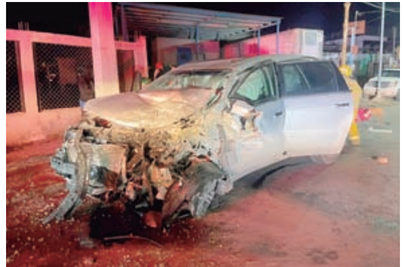
■ El aparatoso accidente ocurrió enfrente de una gasolinera en Revolución y Bajío, en el ponientazo.

Bomberos y paramédicos trabajaron arduamente para rescatar a los conductores de los vehículos colisionados y en su ambulancia los llevaron a un hospital cercano para recibir atención médica.