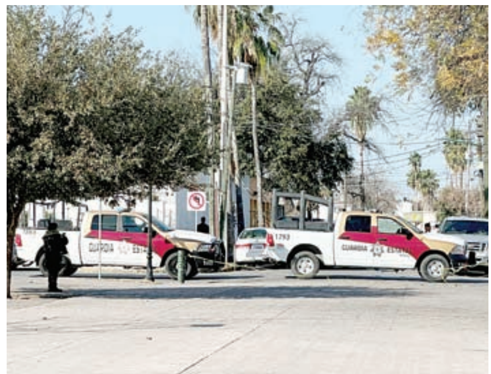
Autoridades se presentaron en el sitio al serles reportado el más que reproble acto; se iniciaron las investigaciones respectivas.