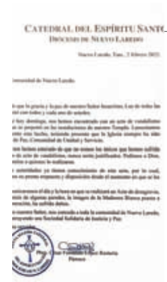
Asimismo, la Catedral señaló en un comunicado que habrá un "acto de desagravio".