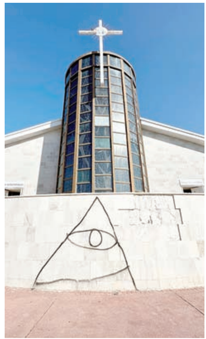
El ataque causó indignación entre feligreses y autoridades eclesíásticas de la ciudad.

Las autoridades locales han sido notificadas y se espera que las investigaciones permitan identificar a los responsables de este acto de vandalismo. Hasta el momento, no se ha revelado mayor información sobre los presuntos autores o sus motivaciones.