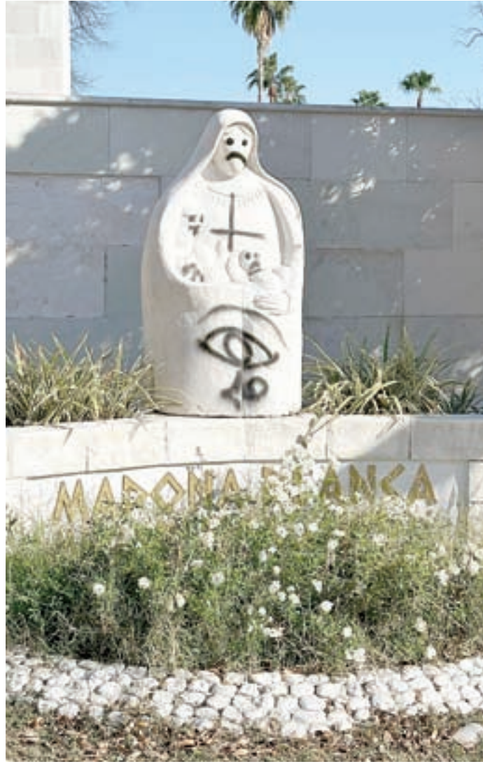
La escultura de la Madona Blanca también sufrió daños significativos.

Les comunicaremos el día y la hora en que se realizará un Acto de Desagravio, ya que además de algunas paredes, la imagen de la