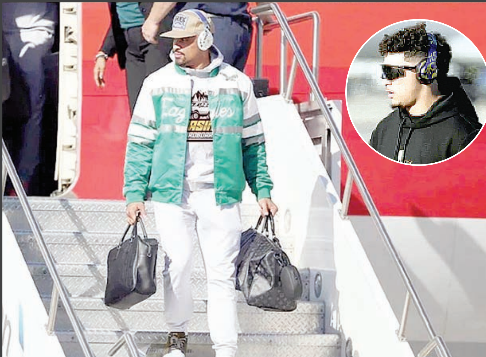
Philadelphia fue el primero que arribó a la ciudad que será centro de las miradas del deporte en la presente semana.

KANSAS CITY Y PHILADELPHIA PROTAGONISTAS DEL SUPER BOWL LIX ARRIBAN A NEW ORLEANS, SEDE DEL DUELO POR EL TÍTULO DE LA NFL