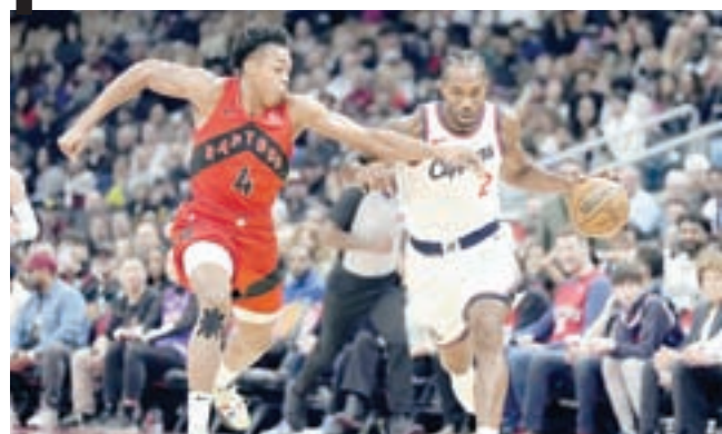
■ Scottie Barnes de Toronto busca quitarle la "naranja" a Kawhi Leonard de Clippers, en el duelo de anoche.

20 tiros y 2 de 9 desde la línea de 3 puntos. Acertó 9 de 9 tiros libres.